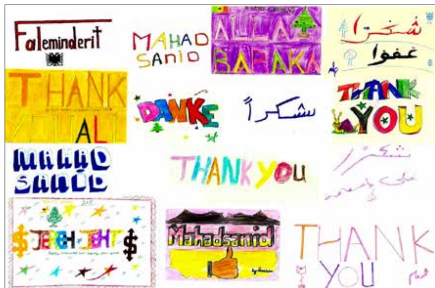
Ein Dankeschön der unbegleiteten minderjährigen Geflüchteten in der Notaufnahme für die Spende einer LL-Stifterin zur Weihnachtsfeier.

Ein neues Stifterdarlehen in Höhe von 300.000 Euro generierte ab dem 4. Quartal ebenso zusätzliche frei verwendbare Erträge, die das Förderbudget erweitern.