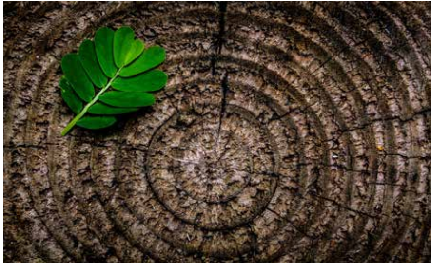
Die Baumscheibe: Ein Sinnbild für Dauerhaftigkeit

Die vierte und fünfte LL-Generation mit heute zusammen 45 StifterInnen ist nun allein verantwortlich, den Stiftungszweck «Zukunft stiften durch Bildung | Ausbildung | Arbeit» durch die Förderung von