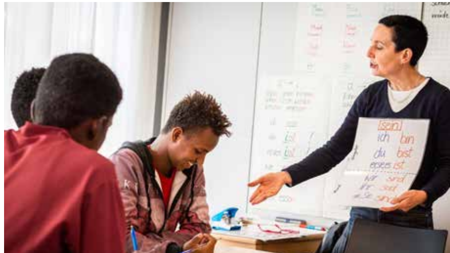
Sprachförderung vom ersten Tag an – das Handbuch war zu diesem Zeitpunkt noch in Arbeit!

Die LL-Stiftung entschloss sich 2015 , die Arbeit der Notaufnahme mit einem Sprachförderprogramm für drei Jahre