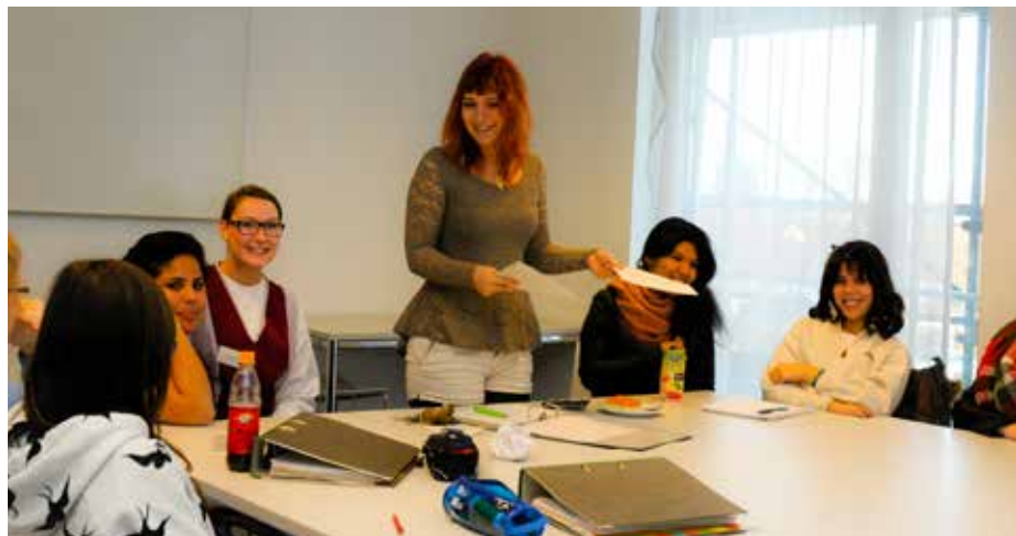
Einstiegs und Krisencoach im Einsatz bei der Moderation der Wahl der TeilnehmerInnenvertretung

Bemerkenswert ist das Projektergebnis besonders vor dem Hintergrund, dass die Rahmenbedingungen in den vergangenen Jahren schwieriger geworden sind: Die Kostenträger vermitteln häufiger Jugendliche, die multiple Problemstellungen, wenig Perspektiven und oftmals mangelnde Reife für die Ausbildungsmaßnahmen mitbringen. Das erfordert zunehmend mehr Sozial- und Bindungsarbeit, die aber nicht refinanziert wird.