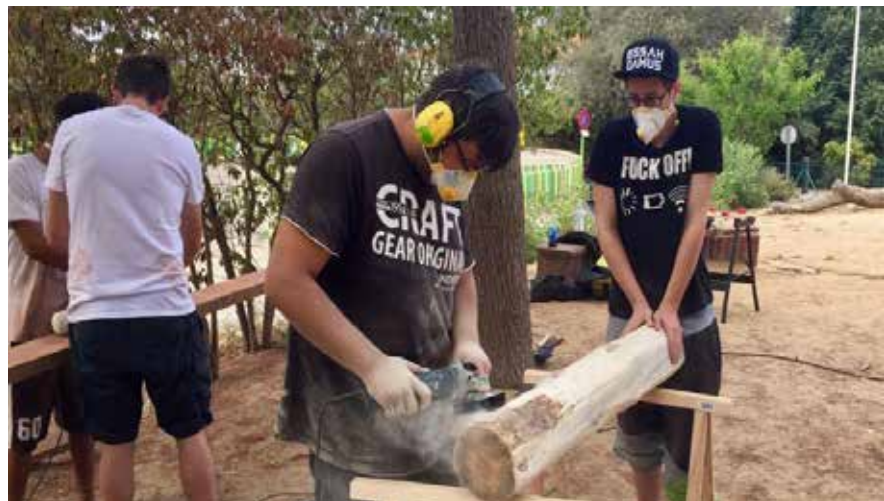
(Kunst-)handwerkliche Talente werden entdeckt: Gemeinsam schaffen wir etwas!

gehörten die KLIMAWERKSTATT für Berufsschüler, das Radikalisierungs-Präventionsprojekt INSIDE OUT , das KUNSTTHERAPIE -Atelier für Flüchtlingskinder in Stuttgart-Heumaden und eine Theater-Schulkooperation des TUSCH! Netzwerks für kulturelle Bildungspartnerschaften. Mit den 2016 ausgezahlten Fördermitteln für die ERZÄHLWERKSTATT des Elternseminars Stuttgart wird eine dreijährige Projektlaufzeit finanziert, so dass auch dieses Projekt im Portfolio verbleibt. Zum letzten Mal und 2017 ausschließlich aus einer Projektspende gefördert wurden zwei FSJ-Stellen an der Carl-Benz Schule, einer Brennpunktschule in Stuttgart-Hallschlag.